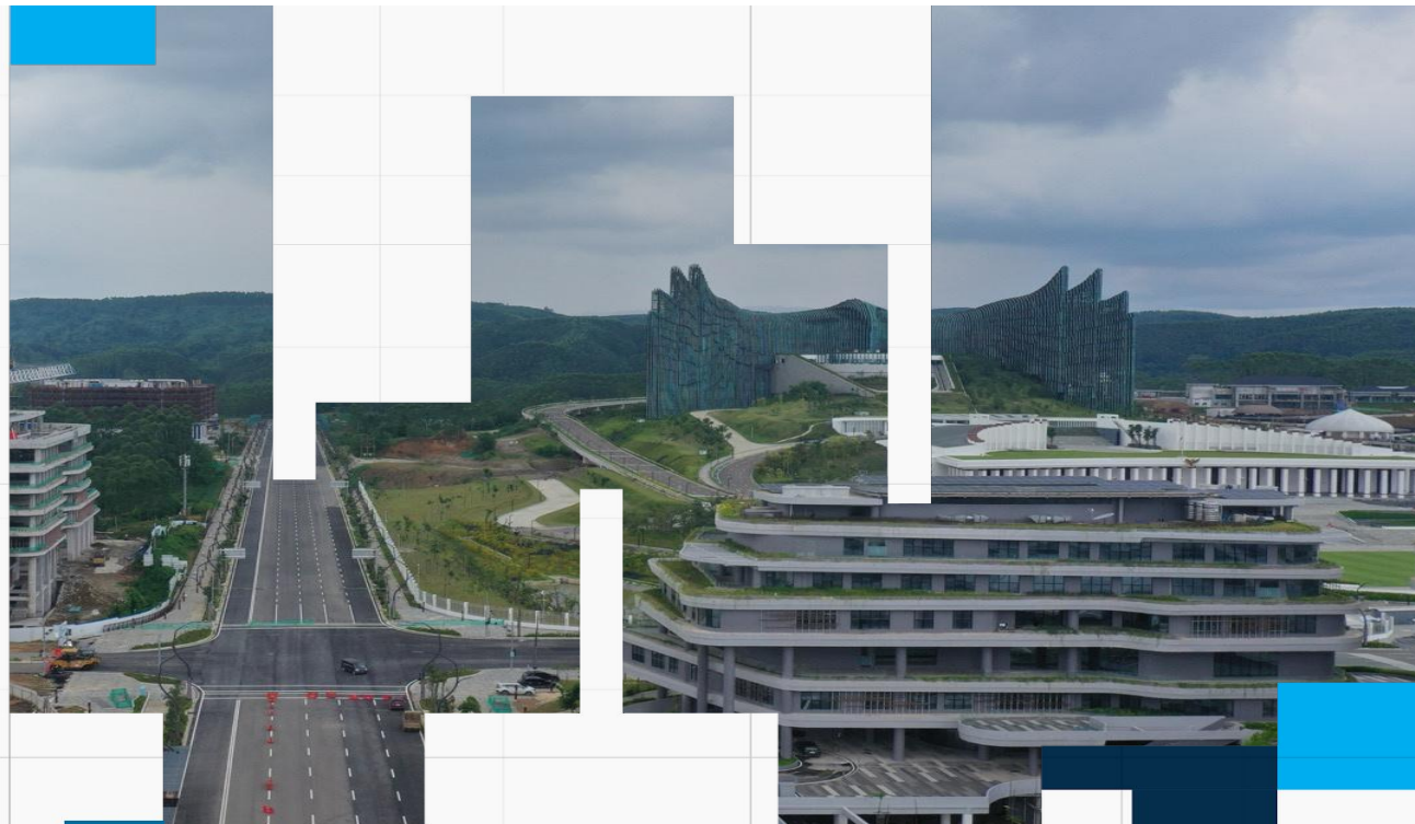
Jalan Sumbu Kebangsaan Sisi Timur, Kalimantan Timur